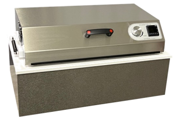
Modèle Table avec Régulateur de température

« R » : Version avec Régulateur de température